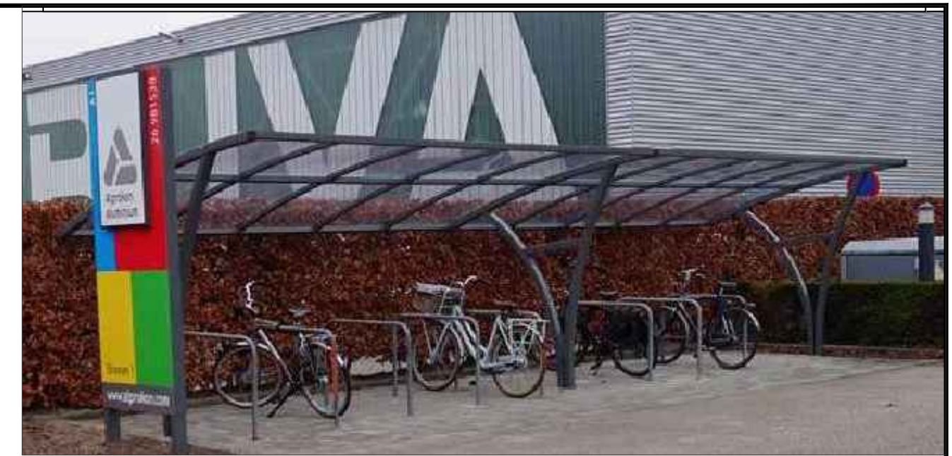
Foto verlengde overkapping