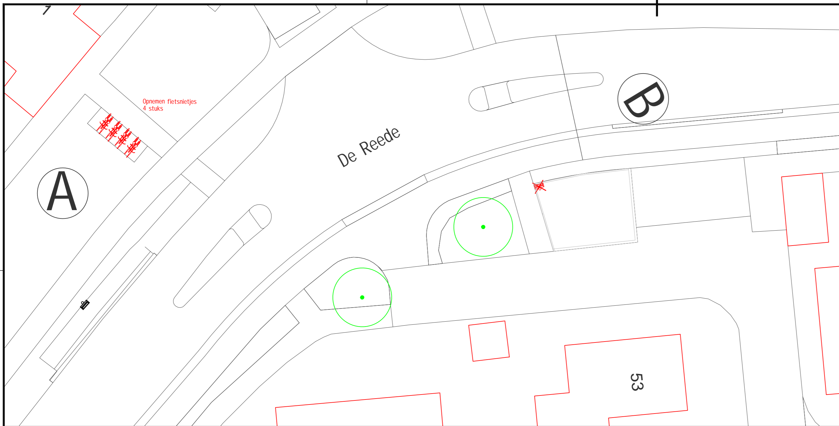
De Reede, Halte Regge, bestaande situatie