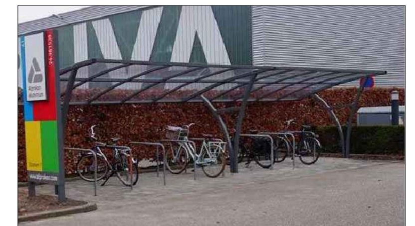
Overkapping (donker grijs)