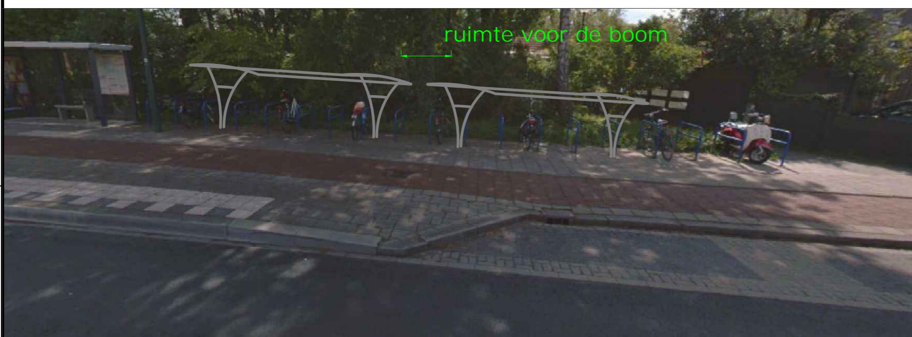
4.6B Bestaande situatie met ingetekende overkappingen