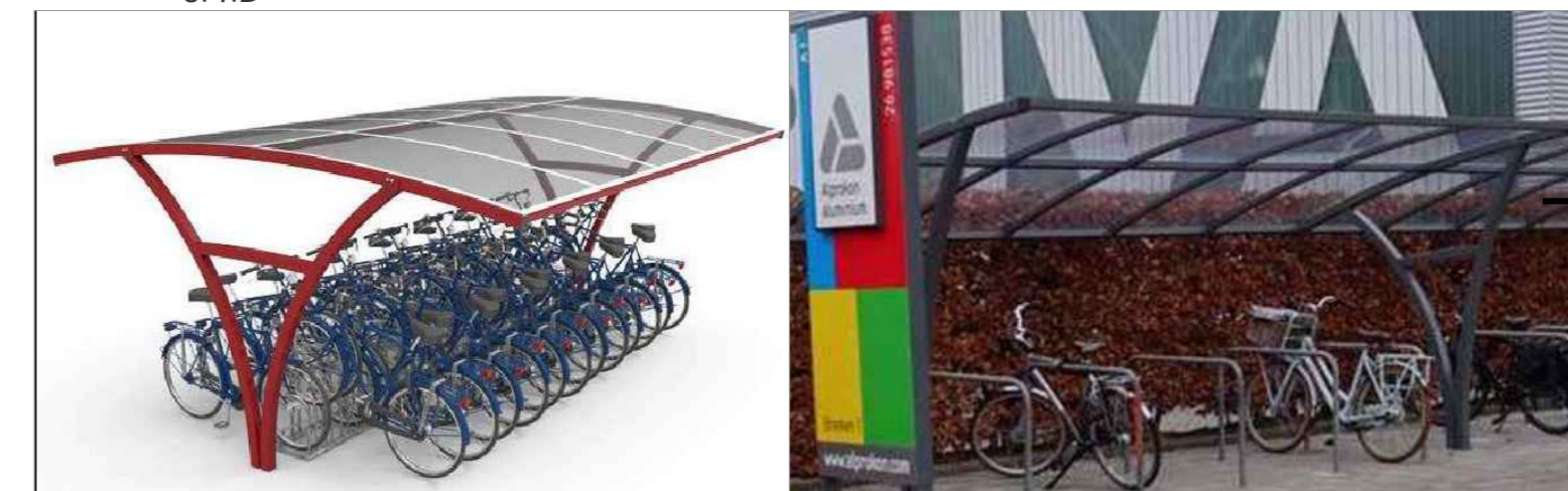
Dubbele overkapping (in het werk donkergrijs)