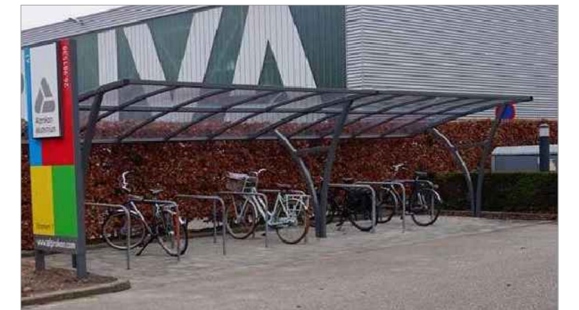
Overkapping (donker grijs)